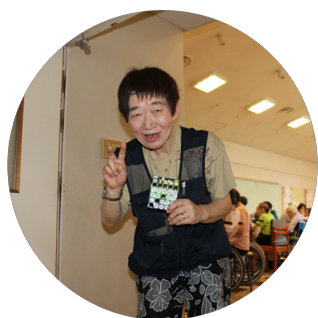
今年は私がビンゴ1位通過！