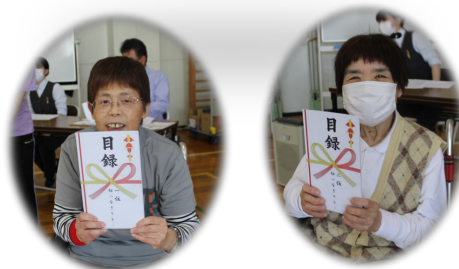
景品目録ゲットだぜ！