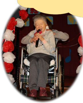
十八番を披露してくれた2人 何度聞いても素晴らしい歌声です♪