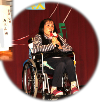
感情を込めて熱唱中 🎤🎵 衣装もバッチリ決まっています 📺