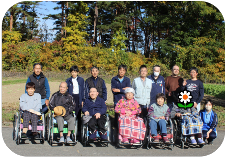
大姥堂へ秋の散策に