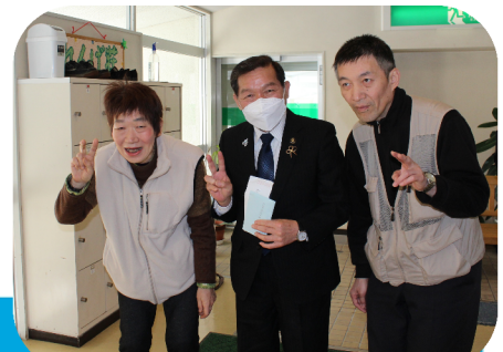
大町市長さん来所